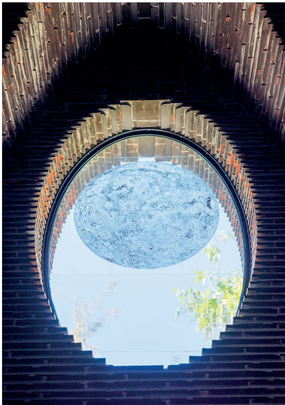
Moon. 2022. Vitrail. Chapelle du Manteau de Marie, Freising. (© Kiki Smith; © Diözesanmuseum Freising; © Thomas Dashuber)

The refrain is: "I see the darkness." I love it. They try to make it think it's a bad thing but to me it's such a relief.