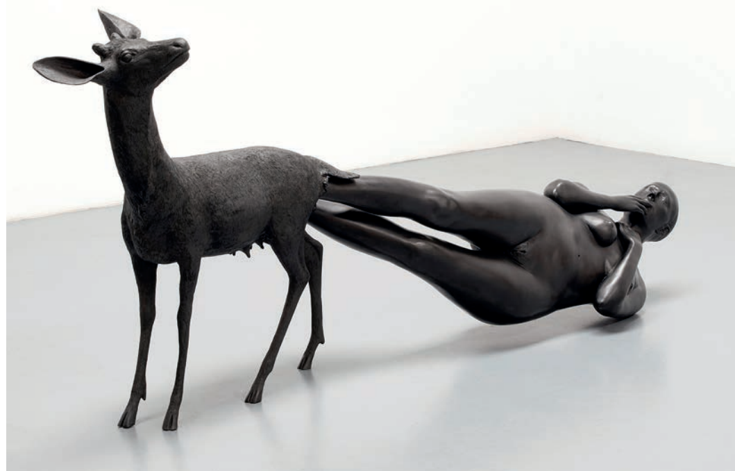
De gauche à droite : Sainte Geneviève. 1999. Encre sur papier Nepal. 272 x 215 cm. Born. 2002. Bronze. 100 x 256,5 x 61 cm. © Kiki Smith ; Court. Galerie Lelong)

That was during the AIDS crisis. It wasn't the reason why I did it. It was more to have a different connection to a body rather than just my own subjective. It was very interesting to listen to something from a medical perspective. I had taken advanced lifesaving